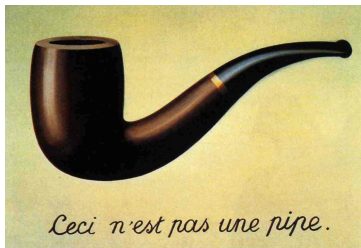
La trahison de images 1928/29

Montrer d'autres œuvres de Magritte (1898/1967) avant de parler du Surréalisme.