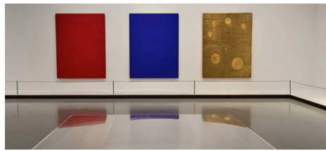
(monochromes d' Yves Klein)

En s'inspirant du film et en se servant de la musique, inventer une chorégraphie colorée.